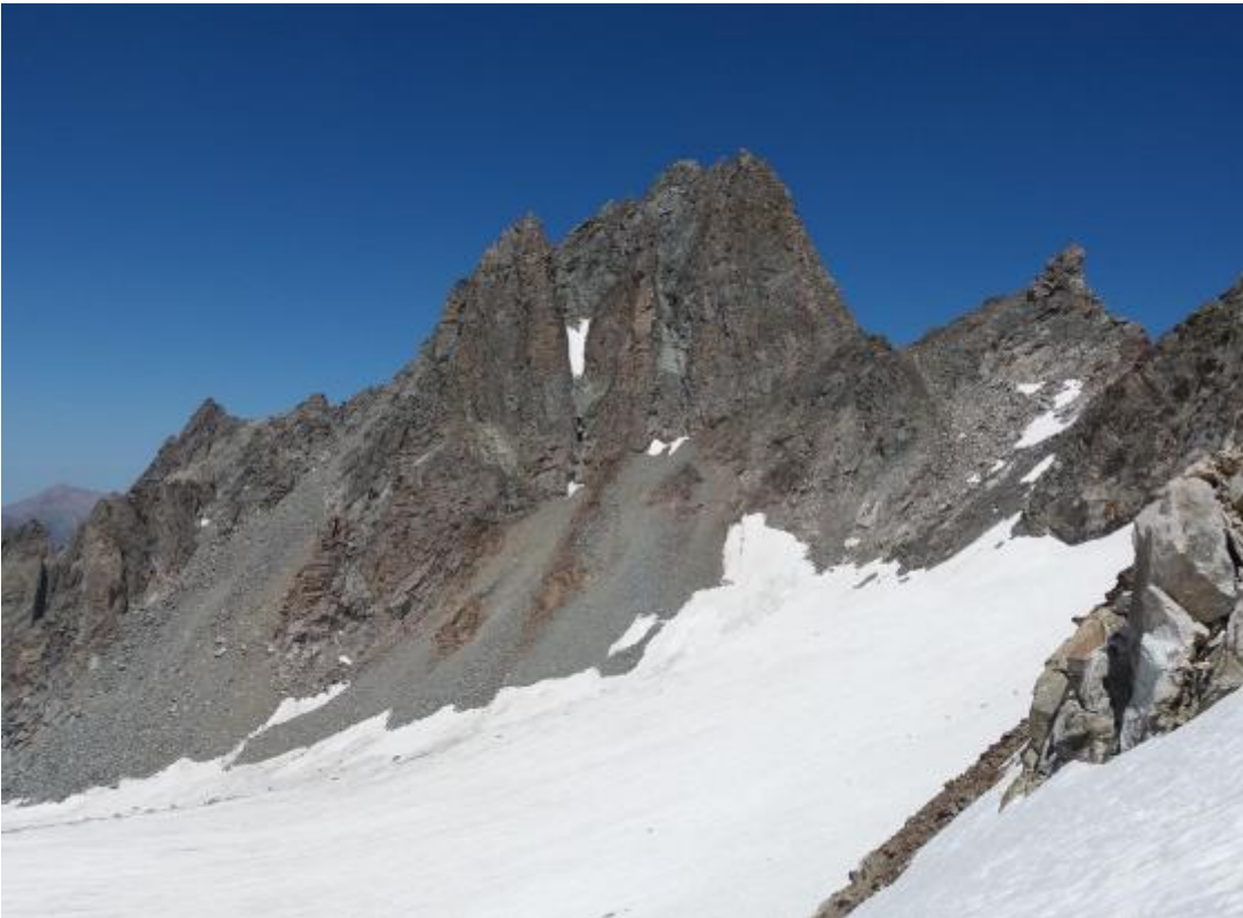
Skats uz VMF virsotni no Džalovčat pārejas