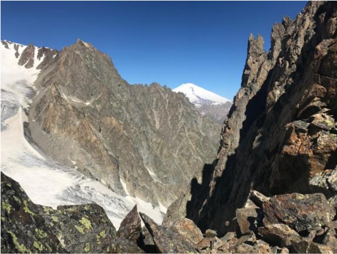
Skats no pārejas starp VMF un Žandarmu uz Kumači ledāju