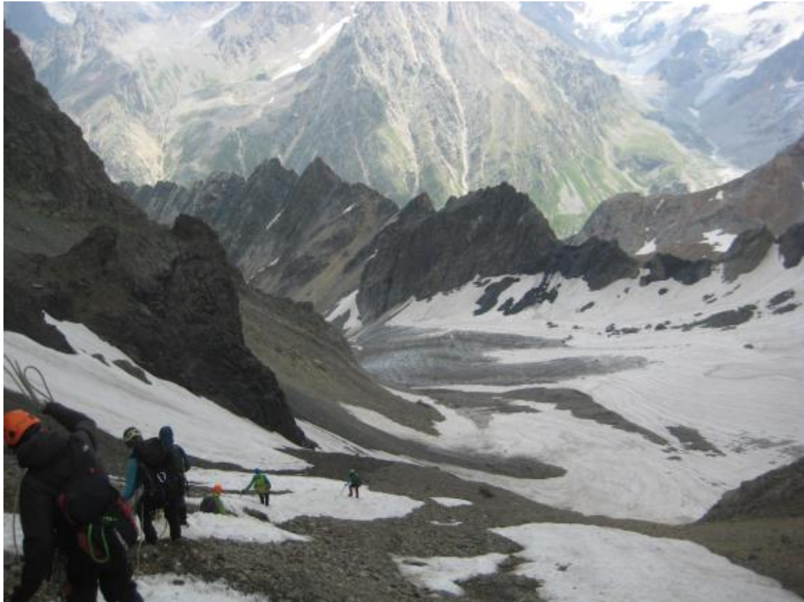
Attēls 10 lejup no virsotnes