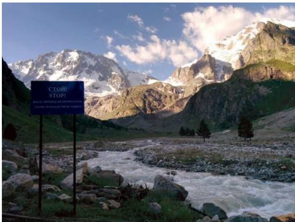
Attēls 3 Robežsargu kontrolpunkts