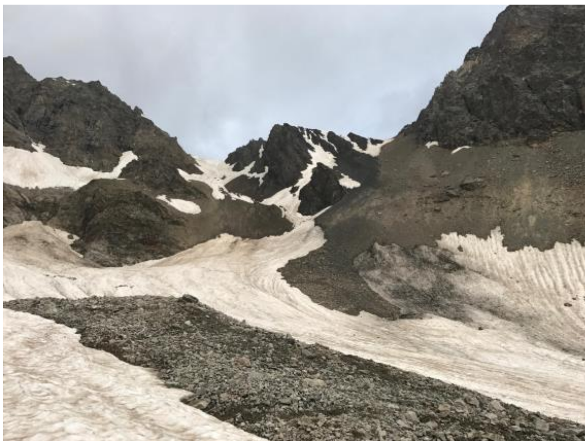
Attēls 6 Skats uz Kojavgan pāreju