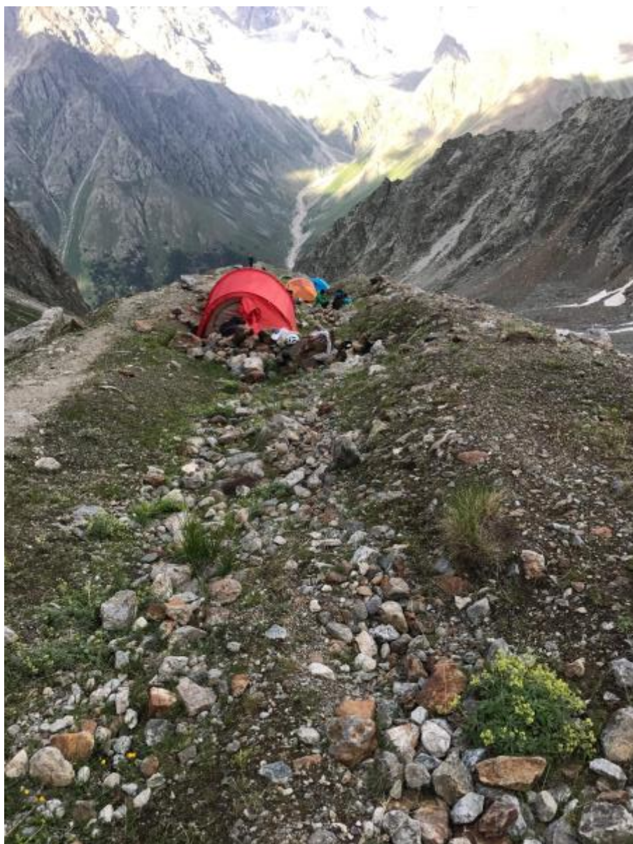
Attēls 5 Nakšņošanas vieta Kojavganskijē načovki uz morēnas