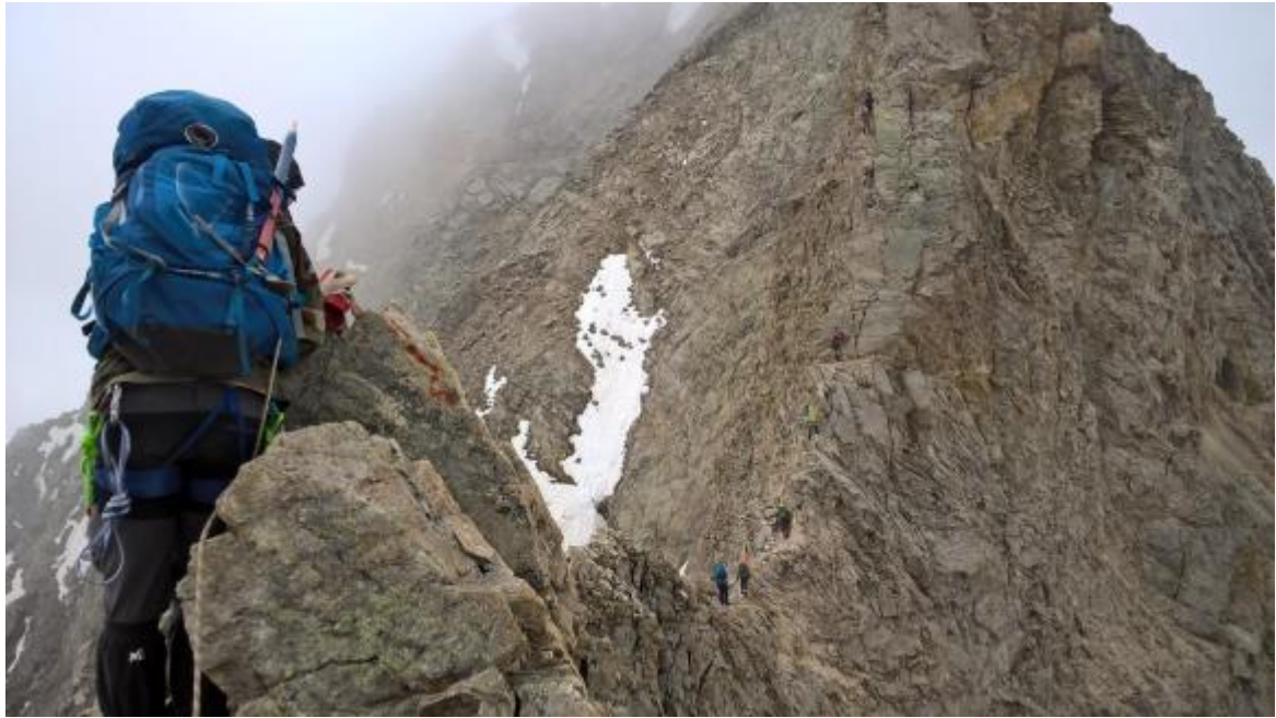
Attēls 8 Skats no Kores uz virsotni skats uz klinšu plāksni R5