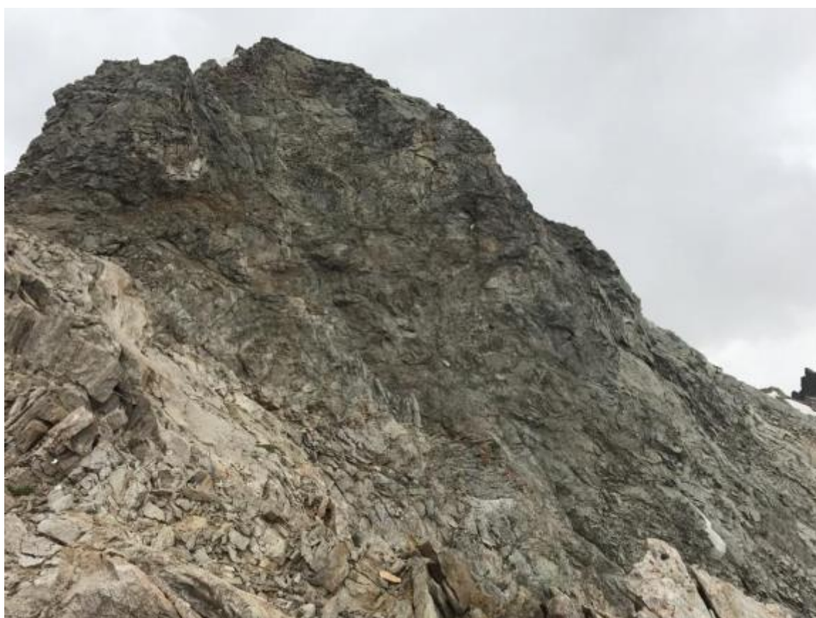
Attēls 7 Skats no Kojavgan pārejas uz virsotni