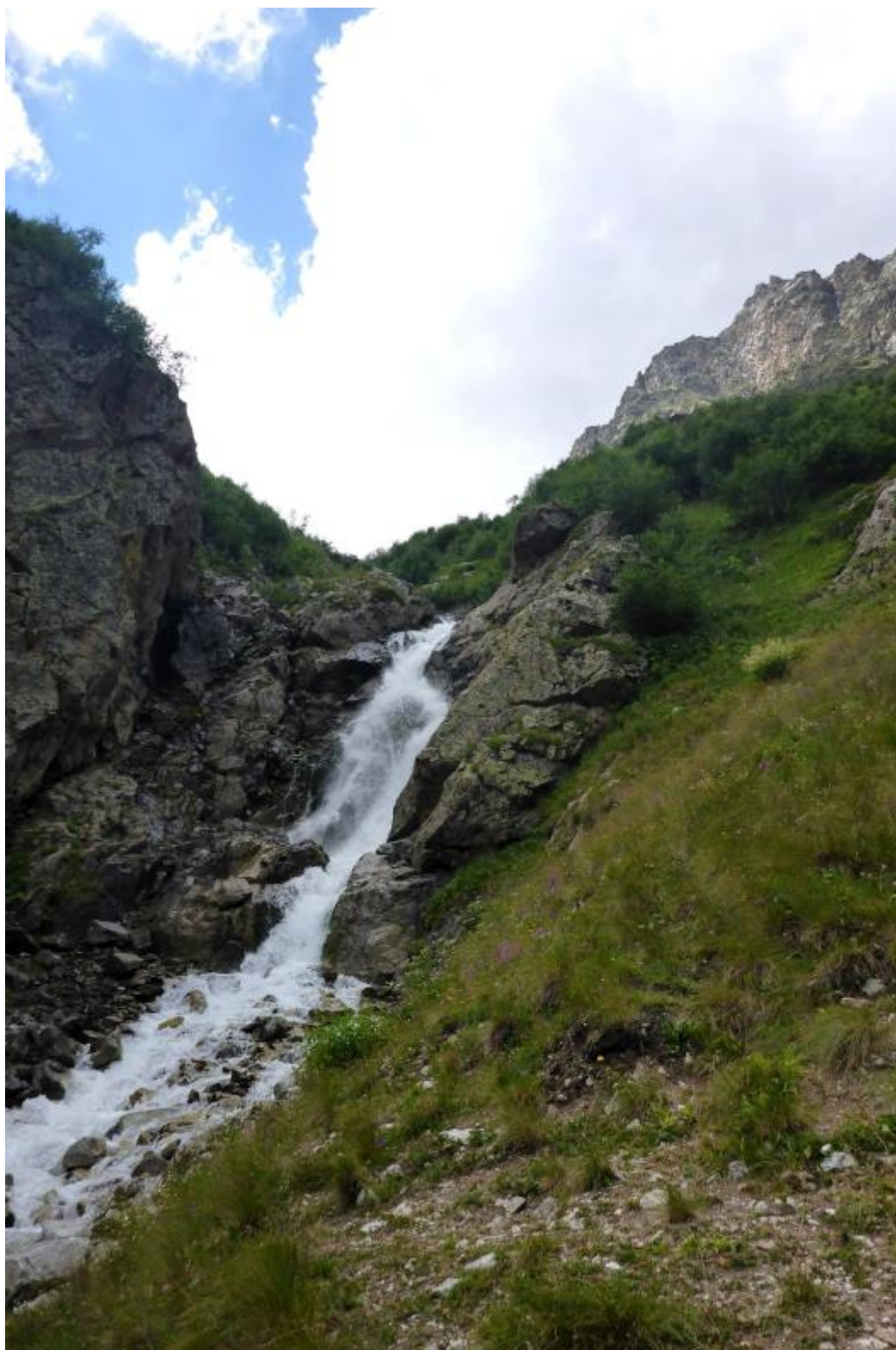
Attēls 4 Morēna gar ūdenskritumu