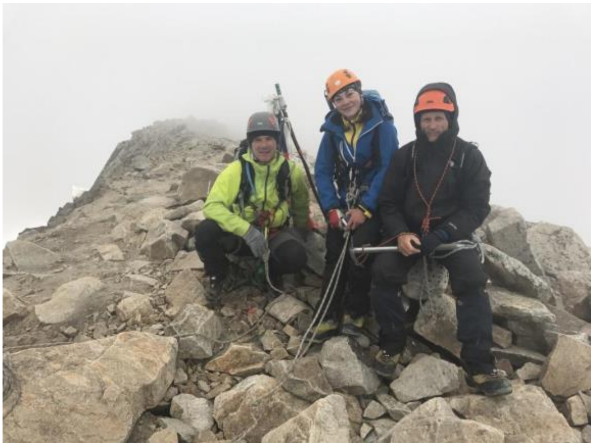
Attēls 9 Virsotnē