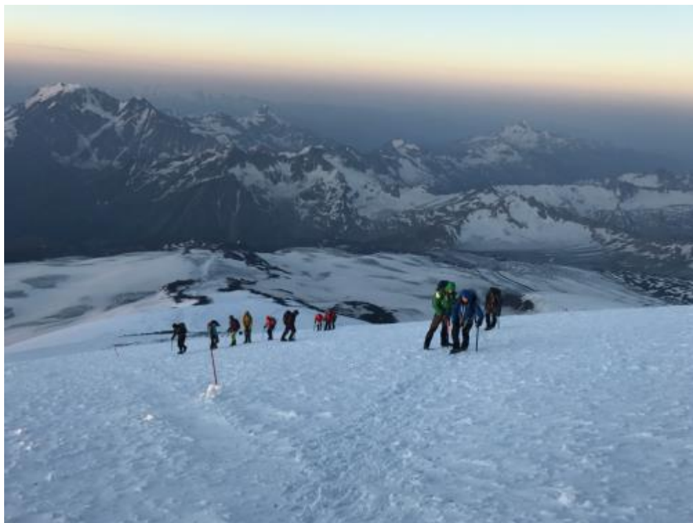
Starp Pastuhova klintīm un sedlieni