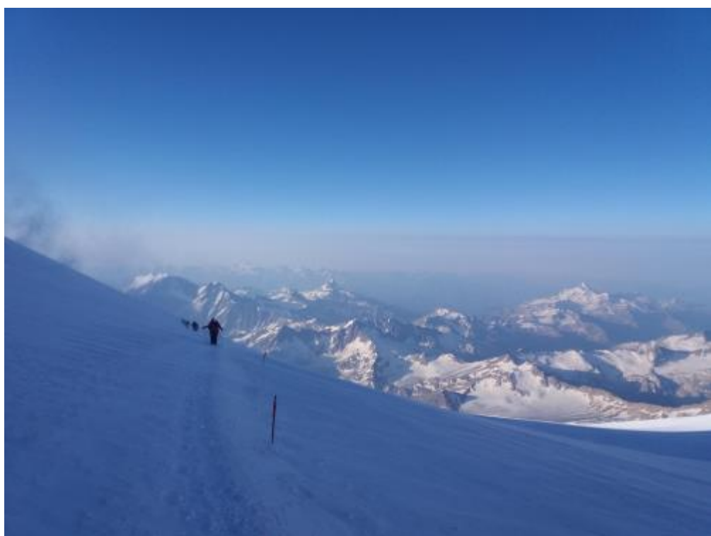
Nogāzes traverss pirms sedlienes