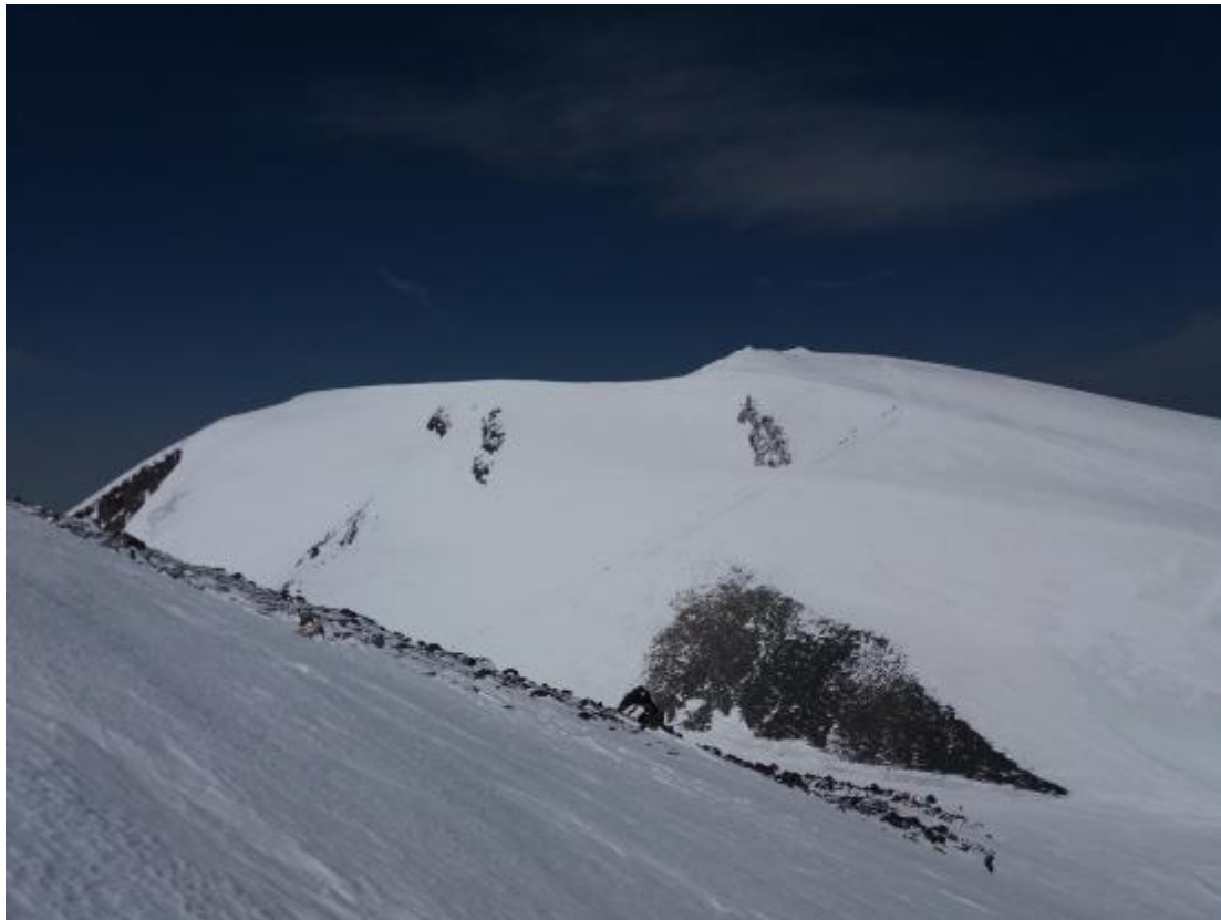
Skats no austrumu virsotnes uz sedlieni