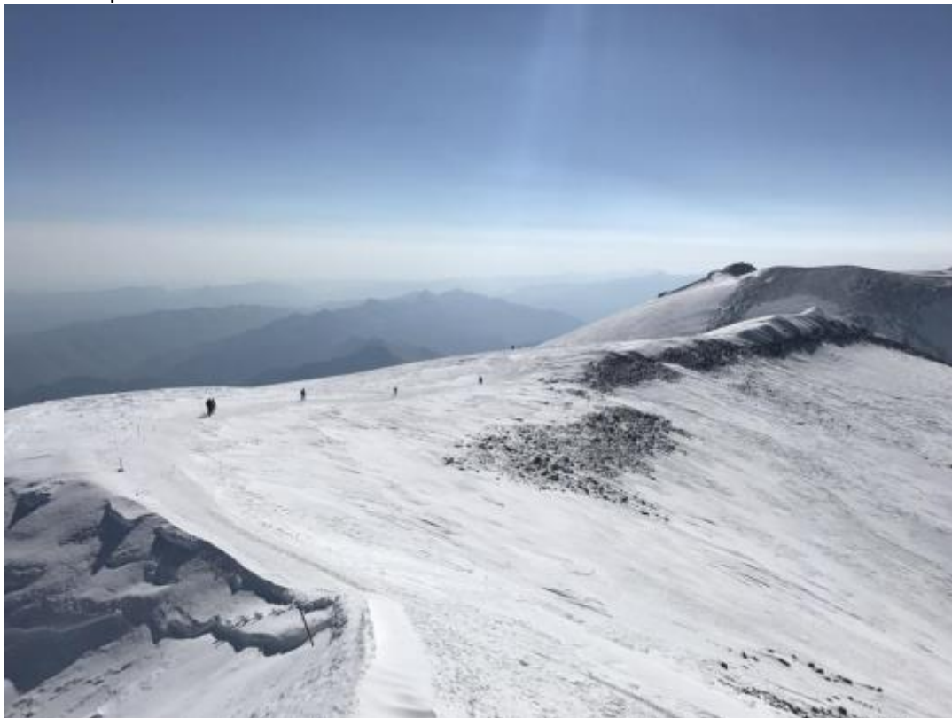
Stadions pirms rietumu virsotnes