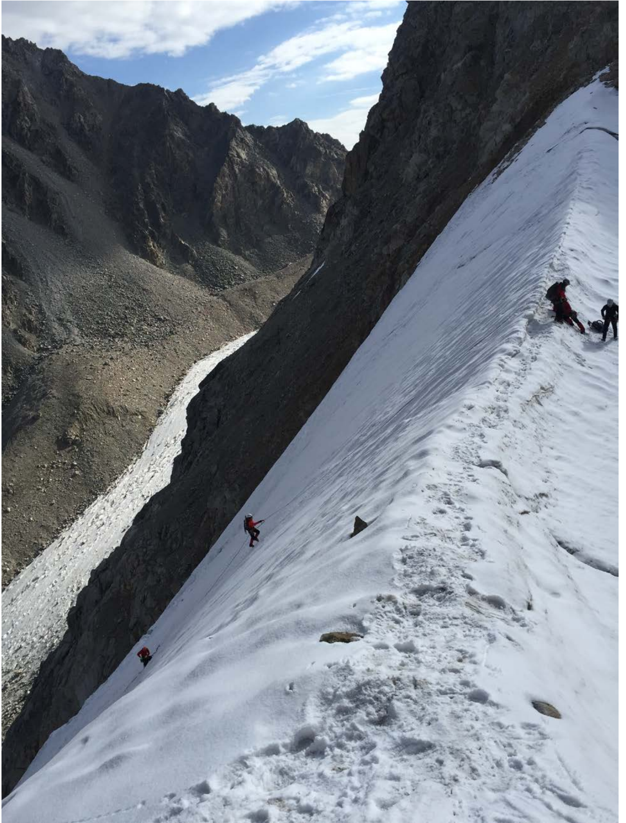
3 att. Urālu pārejas kore