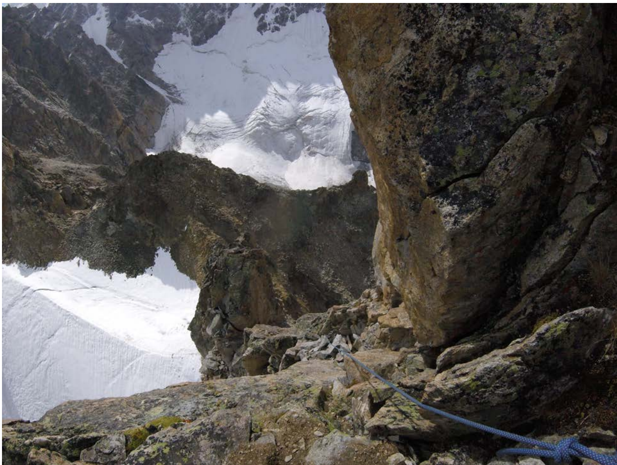
4 att. Skats no žandarma uz Urālu pāreju