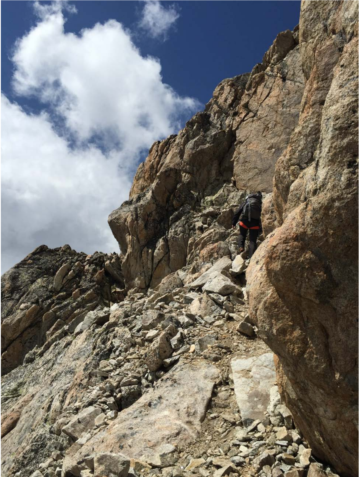
5 att. Uzeja virsotnē