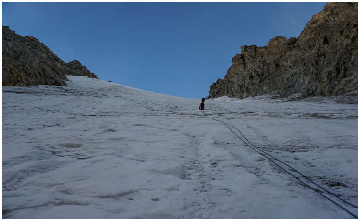
2.att. Urālu pāreja