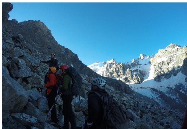
Maršruta sākums pie ieejas kuluārā