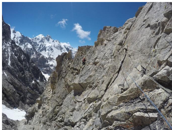
Maršruta vidusdaļa ar gludām klintīm