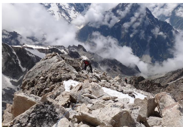
Akmeņu kore pirms virsotnes